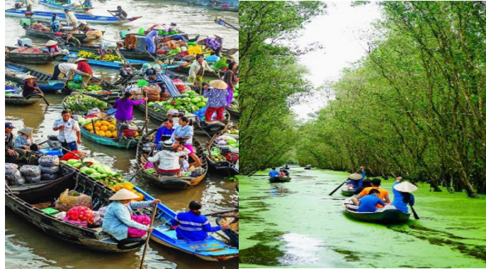
Ăn sáng, trưa, ăn tối